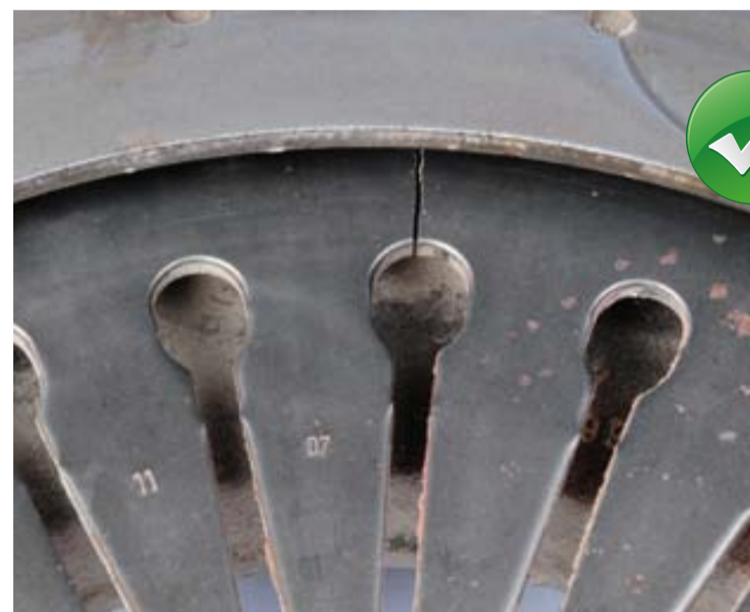
Törött membrán rugó

Back-in-Box: Megkönnyíti a használt alkatrész visszaadását. Az egyszerű és biztonságos visszaadás érdekében a használt alkatrészeket a pótalkatrészek eredeti csomagolásába küldje vissza.