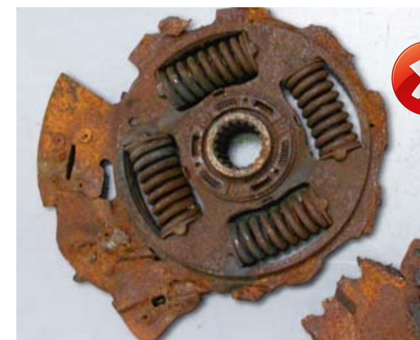
A darab nagymértékben korrodálódott